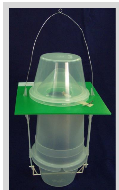
Рисунок 10. Модифицированная воронкообразная ловушка

Эта ловушка действует по тем же принципам, что и ловушка МкФ. При этом МПЛ с сухим синтетическим аттрактантом является более эффективной и избирательной, чем МПЛ или МкФ, в которых используется жидкий ПА. Еще одно важное отличие состоит в том, что обслуживание МПЛ с сухим синтетическим аттрактантом является более результативным и менее трудоемким, чем обслуживание ловушки МкФ. При применении синтетических пищевых аттрактантов диспенсеры прикрепляются к внутренним стенкам верхней цилиндрической части ловушки или подвешиваются к верхней части с помощью зажима. Для