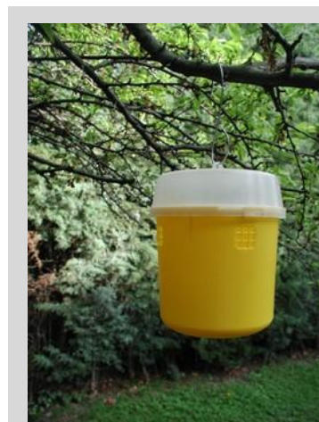
Рисунок 18. Ловушка Тэфри.