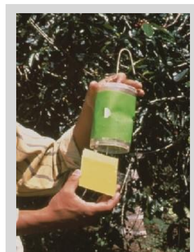
Рисунок 12. Безднищевая сухая ловушка (Этап IV).