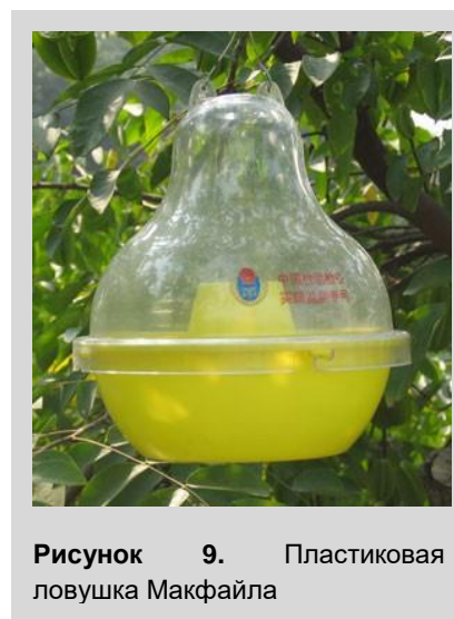
Рисунок 9. Пластиковая ловушка Макфайла