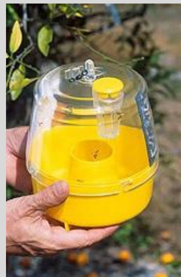
Рисунок 11. Многоприманочная ловушка