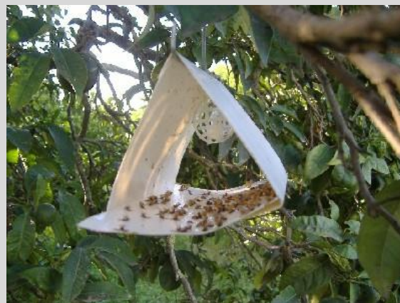
Рисунок 5. Ловушка Джексона, или "Дельта".

Ловушка JT является полой, имеет форму буквы "дельта" и изготовлена из белого вошеного картона. Ее высота 8 см, длина – 12,5 см и ширина – 9 см (рисунок 5). К ее дополнительным элементам относятся белая или желтая прямоугольная вставка из вошеного картона, покрытая тонким слоем клейкого вещества, применяемого для отлова плодовых мух, сажающихся на внутреннюю поверхность корпуса ловушки; полимерная втулка или ватный тампон в пластиковой корзинке или проволочной оболочке; и проволочная подвеска в верхней части корпуса ловушки.