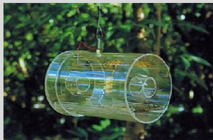
Рисунок 15. Стандартная ловушка Штайнера.

В качестве приманки в этой ловушке применяется гидролизированный протеин в концентрации 9%; однако в ней