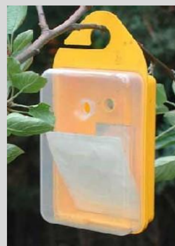
Рисунок 3. Ловушка "Easy"

В этой ловушке используется оптимальное сочетание визуального (флуоресцентный желтый цвет) и химического (синтетическая приманка для плодовой мухи, имеющая аромат вишни) привлекающих сигналов. Ловушка подвешивается на проволоке к ветви или тонкому стволу. Диспенсер приманки прикрепляется к переднему верхнему краю ловушки, причем приманка подвешивается перед клейкой поверхностью. Возможности отлова этой клейкой поверхности составляют порядка 500-600 плодовых мух.