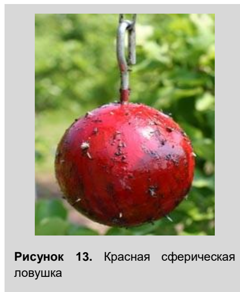
Рисунок 13. Красная сферическая ловушка