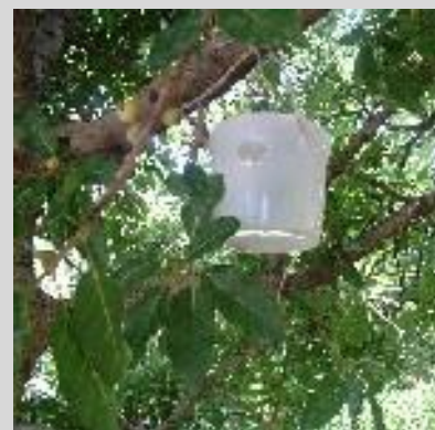
Рисунок 7. Ловушка "Магриб-Мед", или марокканская.