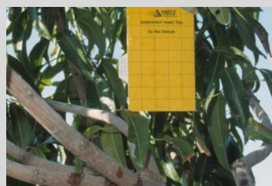
Рисунок 19. Желтая пластинчатая ловушка.