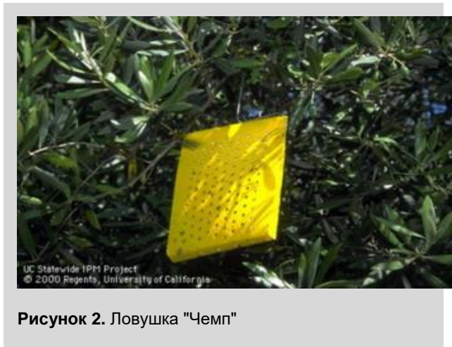
Рисунок 2. Ловушка "Чемп"