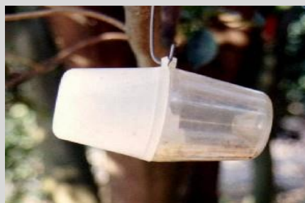
Рисунок 17. Вариант ловушки Штайнера.