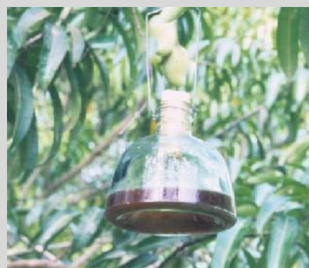
Рисунок 8. Ловушка Макфайла