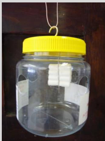
Рисунок 6. Ловушка Линфилда

Стандартная ловушка Макфайла (МсР) представляет собой контейнер из прозрачного стекла или пластика, имеющий грушевидную форму и снабженный внутренним вкладышем. Ловушка составляет 17,2 см в высоту и 16,5 см в ширину у основания и вмещает до 500 мл раствора (рисунок 8). К элементам ловушки