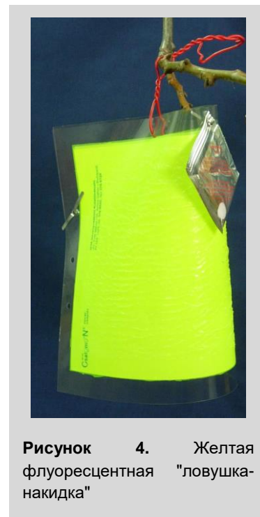
Рисунок 4. Желтая флуоресцентная "ловушка-накидка"