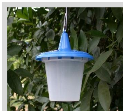
Рисунок 14. Ловушка "Сенсус"