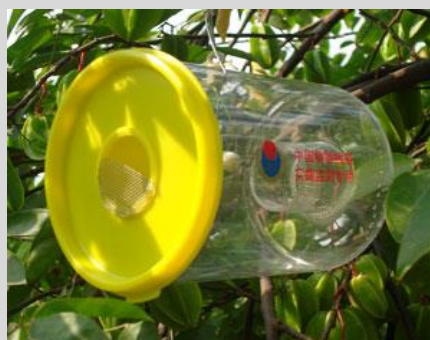
Рисунок 16. Вариант ловушки Штайнера.